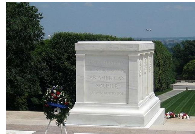
Штат Вирджиния, США