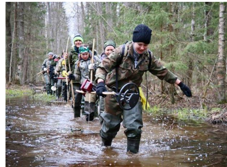
Экспедиции Поискового движения России