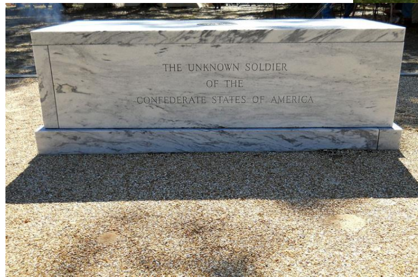
Бовуар, штат Миссисипи, США

В Западном полушарии первый памятник Неизвестному солдату был установлен в США после окончания войны Севера и Юга 1861–1865 годов в штате Миссисипи.