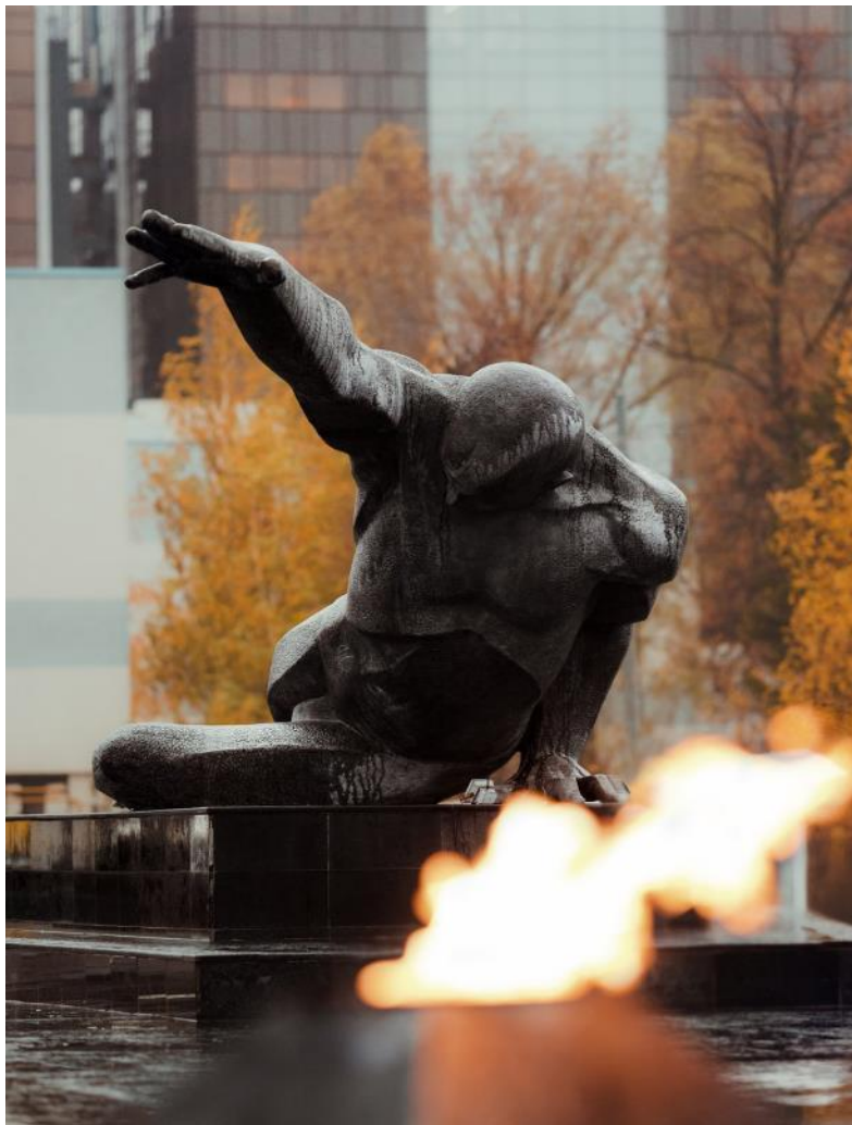
Памятник «Неизвестному солдату». Казань. Открыт в 1967г.