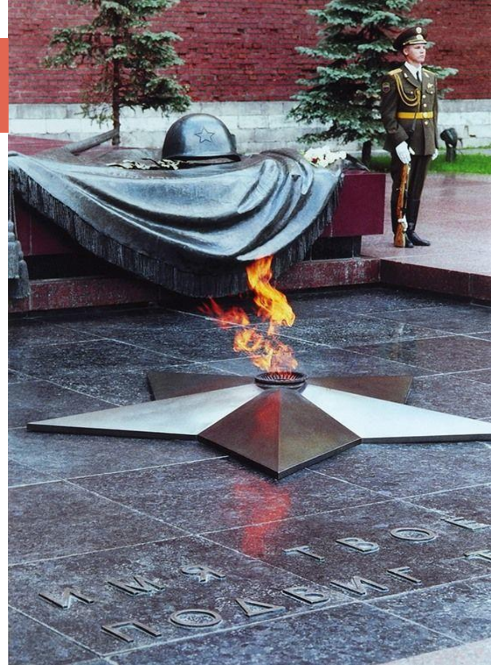
Могила Неизвестного солдата, Москва

«Имя твоё неизвестно, подвиг твой бессмертен»