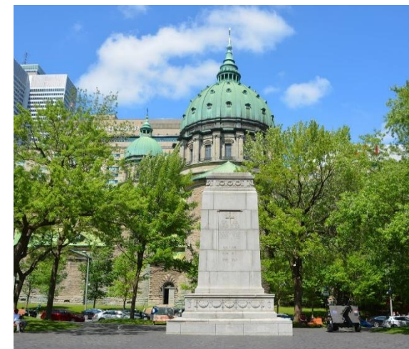
Кенотаф. Монреаль, Канада