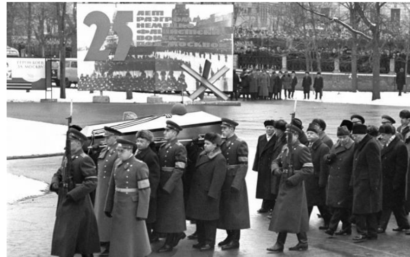
Захоронение у Кремлёвской стены останков Неизвестного солдата. 3 декабря 1966 г.