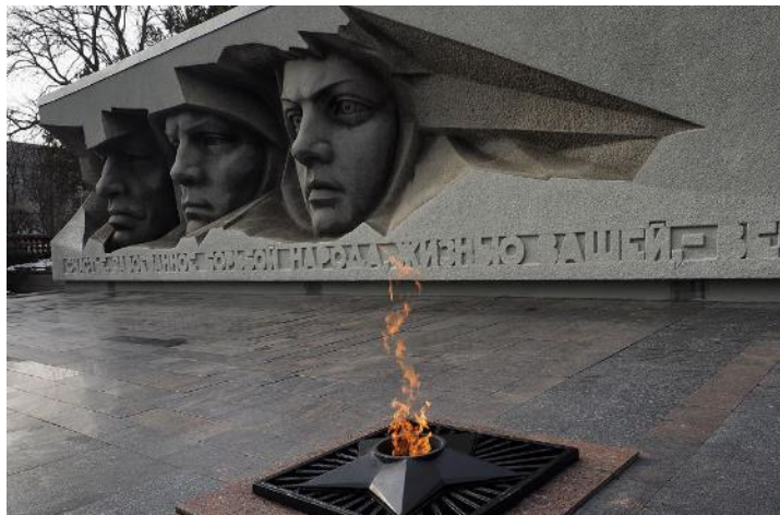
Мемориал «Вечная слава». Ставрополь. Открыт в 1967г.