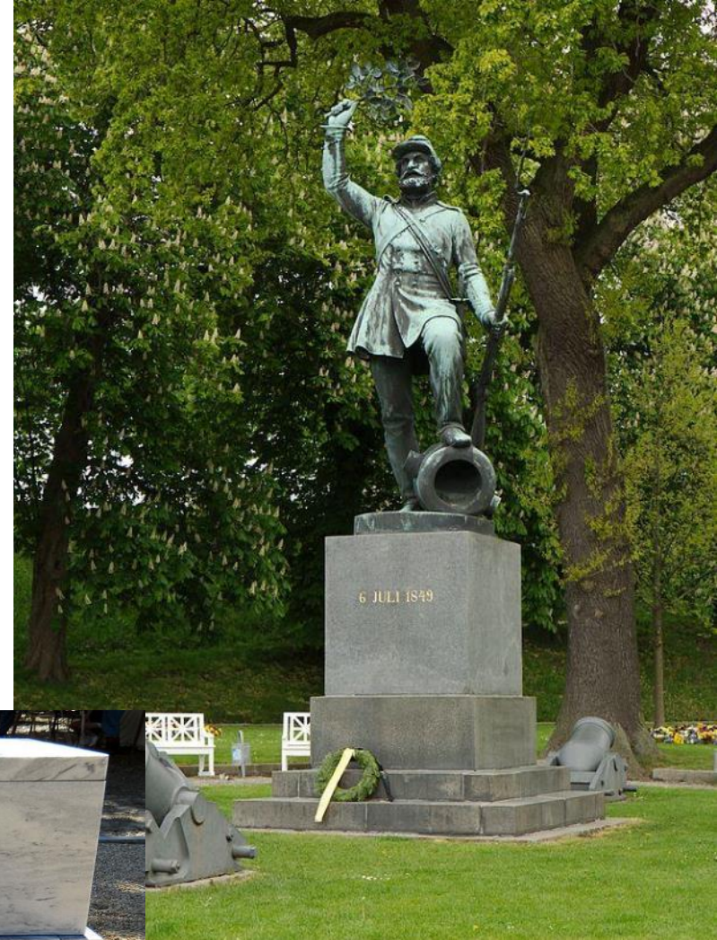
«Неизвестный пехотинец», Фредориция, Дания