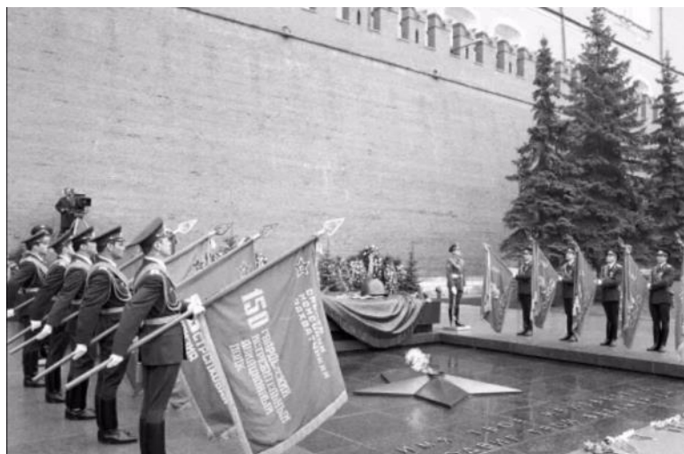
Торжественное открытие мемориала Неизвестному солдату, 8 мая 1967 г.