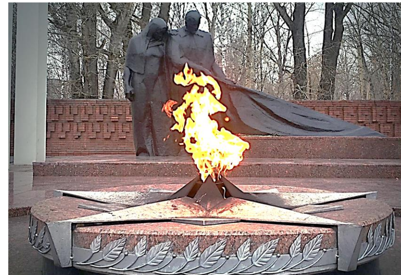
Мемориал «Вечный огонь». Тюмень. Открыт в 1968 г.