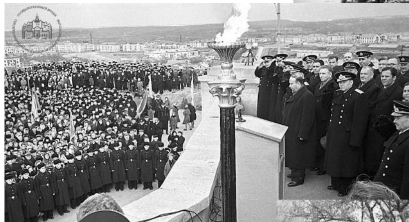
Зажжение вечного огня на Малаховом кургане. Севастополь. 1958 г.

Факел с огнем был доставлен из Ленинграда по эстафете всего за один день. У Манежной площади ценный груз принял знаменитый летчик Герой Советского Союза Алексей Маресьев.