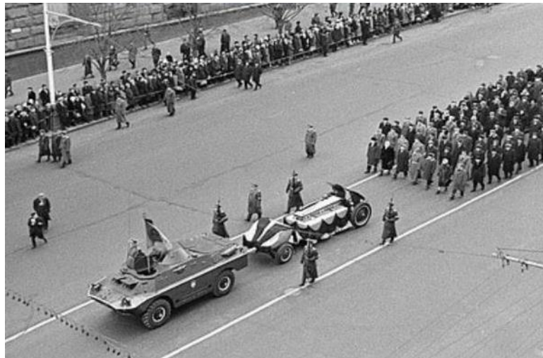
Траурная процессия на Тверской ул. Москвы. 3 декабря 1966 г.

8 мая 1967 года состоялось торжественное открытие мемориала.