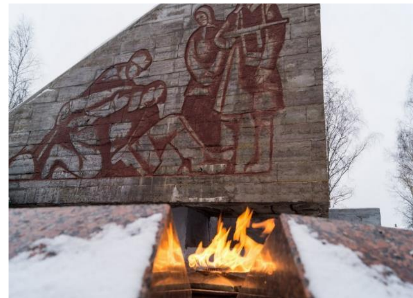
Мемориал «Славы» в Старой Руссе. Новгородская обл. Открыт в 1964 г.