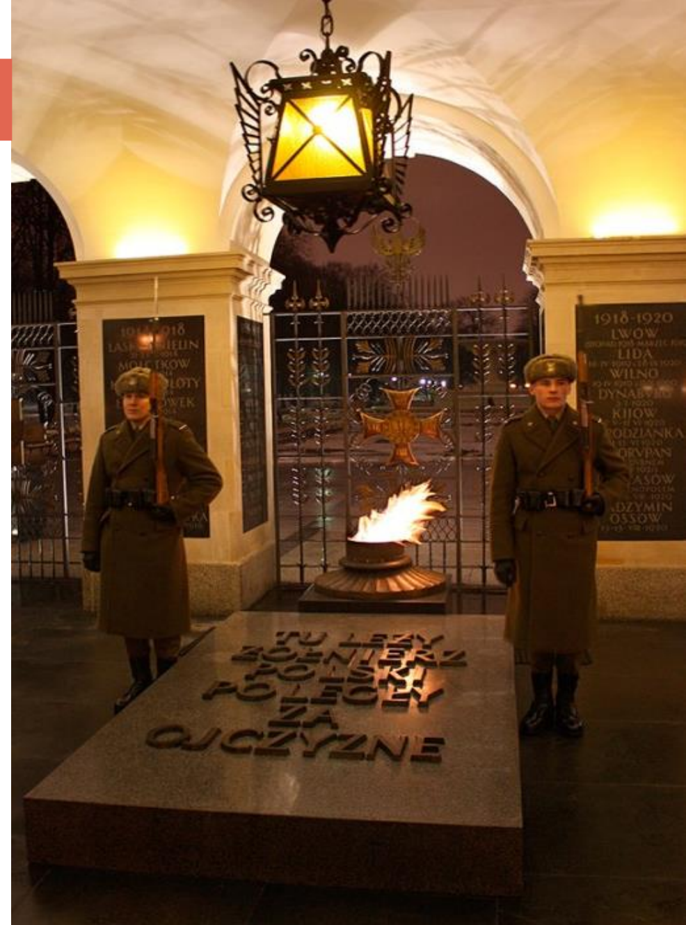
Могилы Неизвестного солдата. Варшава, Польша

Он стал источником пламени для большинства воинских мемориалов , открытых в городах-героях, а также городах воинской славы.