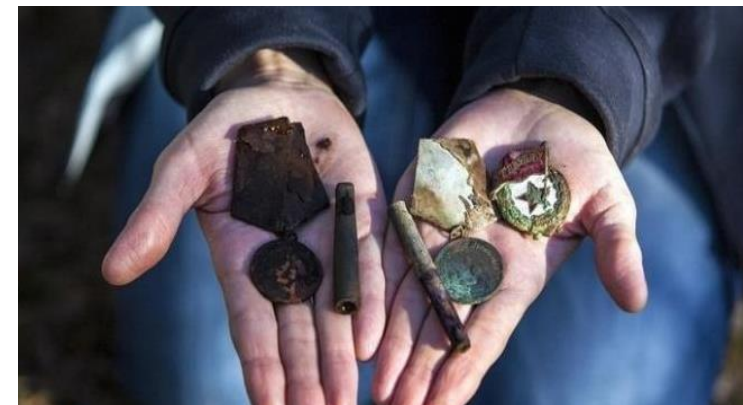
Артефакты, найденные в могиле солдата, погибшего в Тверской области в 1942 г. 2016 г.