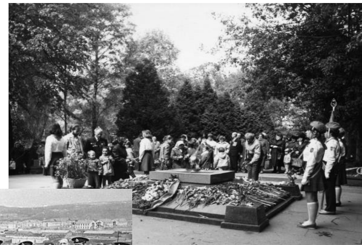
Вечный огонь у военного мемориала на Преображенском кладбище, Москва.