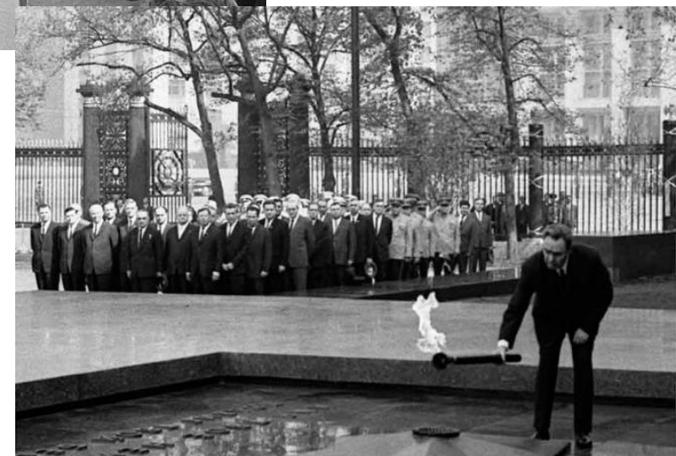
Церемония зажжения Вечного огня у Могилы Неизвестного солдата. Москва. 8 мая 1967 г.