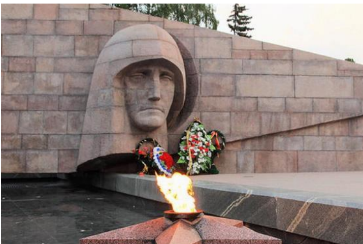
Памятник "Скорбящей матери-Родине". Самара. Открыт в 1971 г.